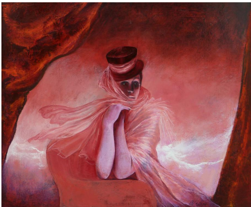
La Vénitienne, Dame des Canaux - De Venetiaanse, Vrouwe der Reien Privécollectie – Lucifernum

Hij flaneert verder. Het lied in zijn oren. Een glimlach om zijn lippen met ergens in zijn achterhoofd het absurde, tedere besef: Soms komt de tulp niet uit Amsterdam. Maar de droom wel.