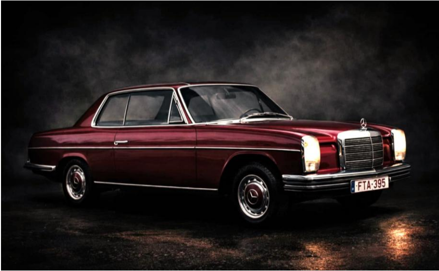
Mercedes 250C/8 coupé uit 1969

de een of andere manier moest de duif, toen hij wat uit de dons was gegroeid en leerde vliegen, een kleine, zeg maar aanloop nemen alvorens hij het luchtruim kon bevliegen. Maar ze hadden ook een hond, Boris was z'n naam. Борис in het Russisch. Nonkel sprak dat uit als Baris . Boris was een speelse boxer die het goed kon vinden bij hun thuis met drie kinderen. Boris was energiek en dat was ook niet zonder de duif gerekend die plots tussen Boris' tanden terecht was gekomen. De duif die buiten Boris' wil kennelijk een doodstrijd leverde tot wanneer de drie broers thuis kwamen van school. Moeder gilde, Boris schrok, liet de duif abrupt uit m'n muil op de grond vallen. De duif gaf nog enkele naschokken. Z'n broer troostte zich met de woorden: "Dat is de wet van de natuur, de wil van God."