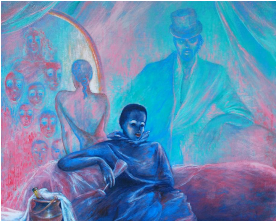
La Chambre des Supplices - De Kamer der Kwellingen Privécollectie – Lucifernum

Wát zou hij geven voor een grand piano in spiegelmozaïek. Voor kaarslicht dat fonkelt in diamanten manchetten. Voor theatrale overdaad met een knipoog. Voor schoonheid zó opzichtig dat ze opnieuw stil wordt. Maar neen. Hier geen Liberace. Hier, vet haar en valse woede. Hier, gitaarherrie verpakt in existentialistische roep. Hier, een witte onderbroek boven een gescheurde jeans. Hij recht z'n rug. Steekt z'n linkerhand in z'n broekzak. Rechterhand z'n canne .