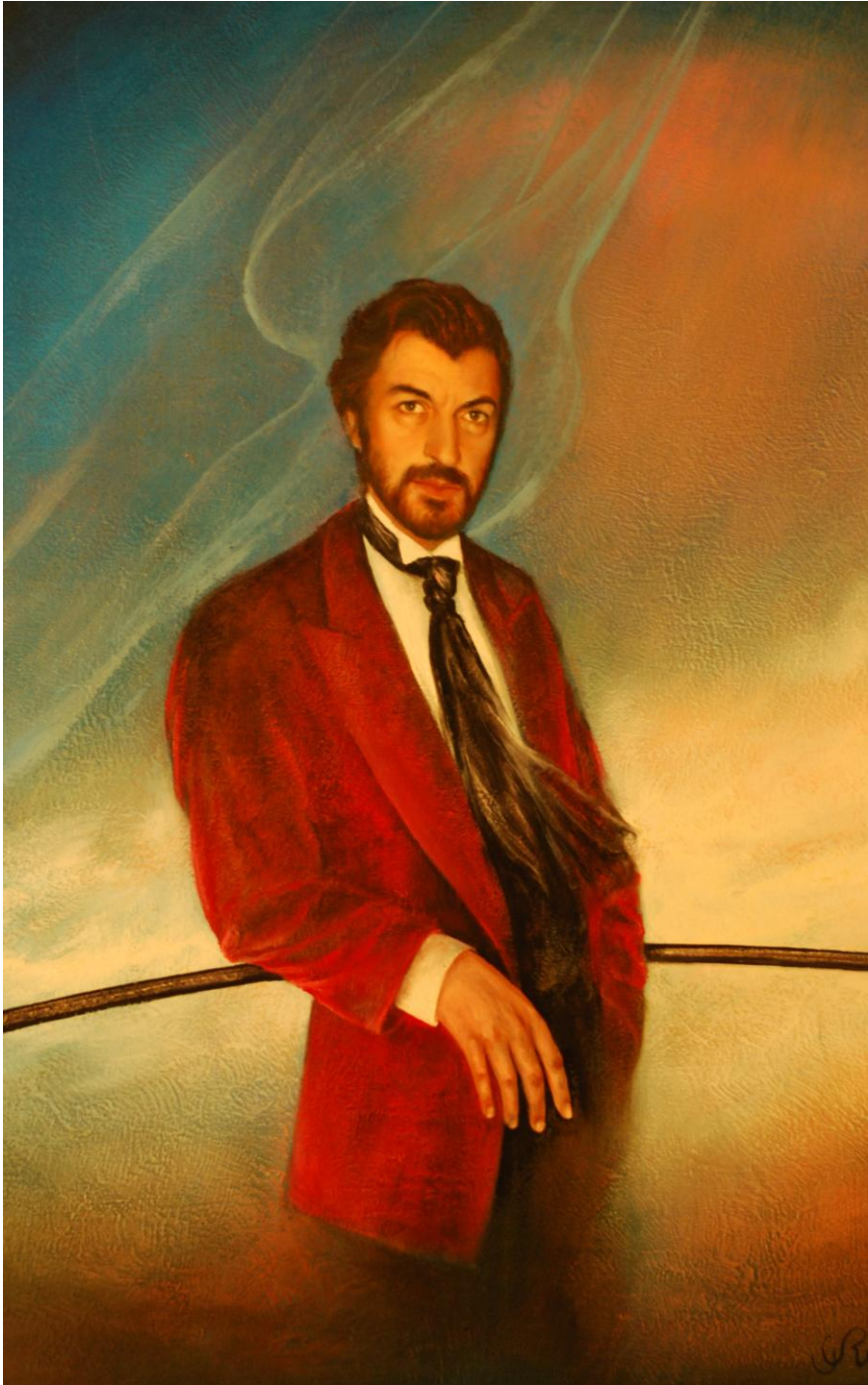
Maître de l'Ombre, Gilbert Retsin Privécollectie – Lucifernum