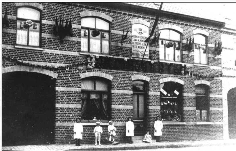
Huis Couterstraat 38, Merkem (1914).