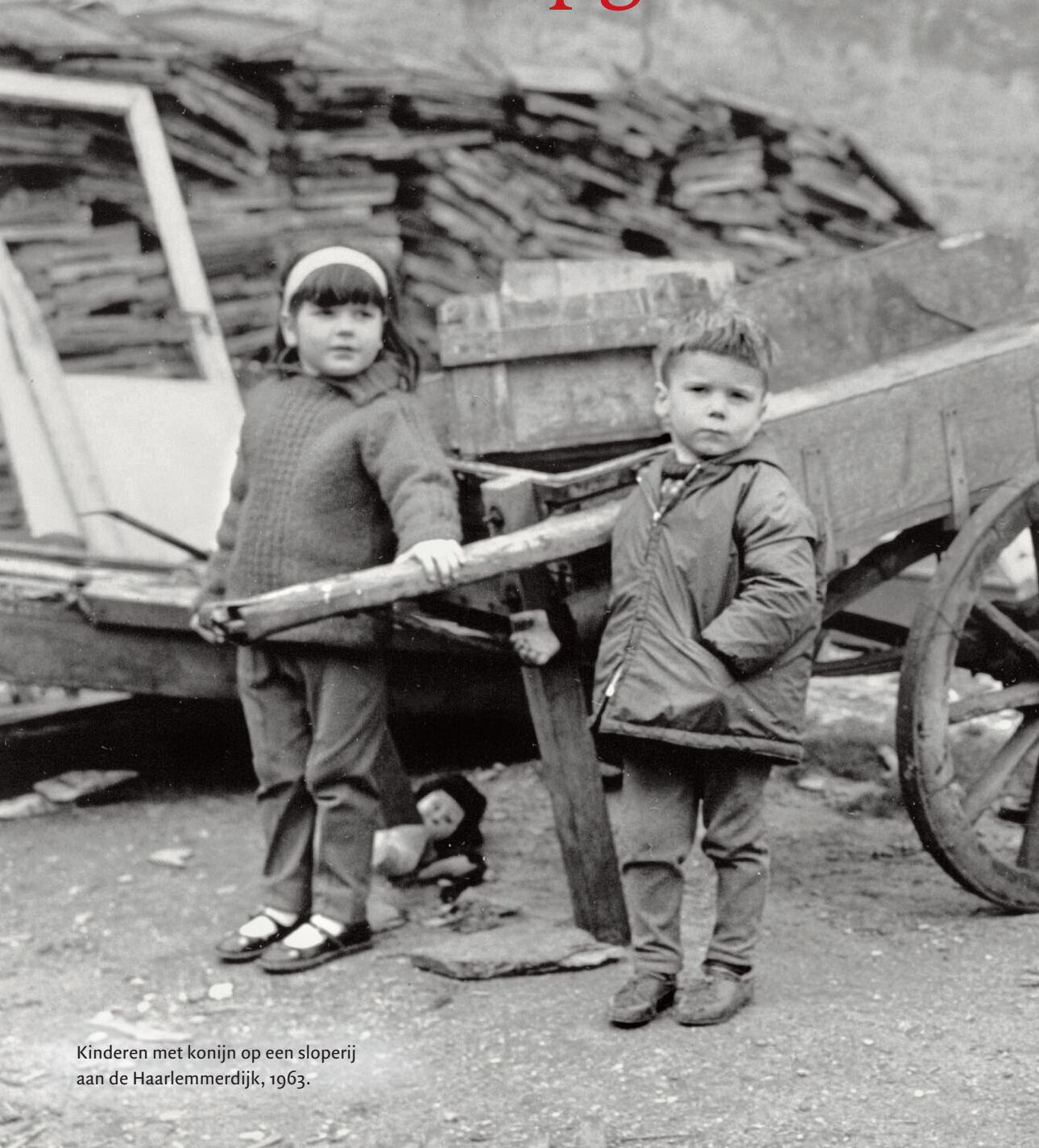
Kinderen met konijn op een sloperij aan de Haarlemmerdijk, 1963.